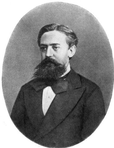
Andrey Markov (1856-1922)