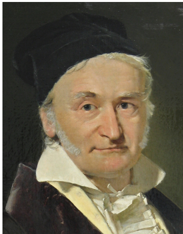
Carl Friedrich Gauss (1777-1855)